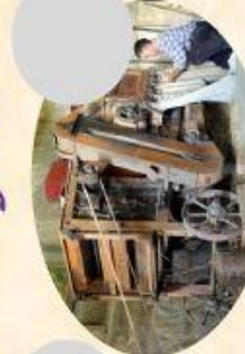
I Mise en route de la Batteuse 1900