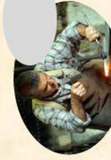
H Le forgeron : travail du métal (20mn)