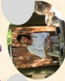
F La fanderie : Fabrication des soldats en étain