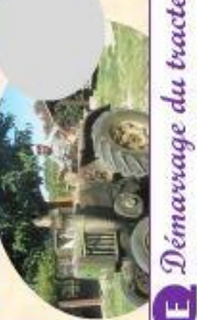
E Démarrage du tracteur Vierzon de 1950 au châlumeau (15mn)