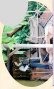
D Le bal musette des automates (5mn)