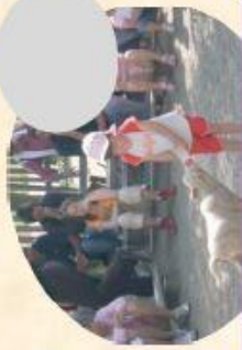
A La tétée des Tout-petits (20 mn)