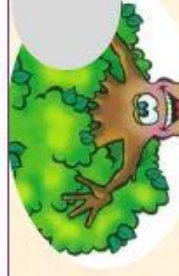
C L'arbre qui parle (10min)