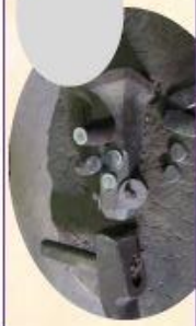
G La frappe de la mennaie (10mn)