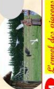
M L'encol des pigeons voyageurs (15mn)