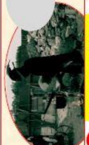
K Spectacle médiéval Grabador le sorcier (15mn)