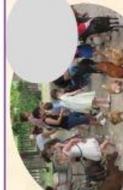
B Aourissage des animaux