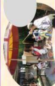
N Le petit carroussel.