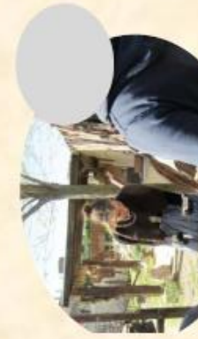
H/ Fabrication des soldats en étain (10mn)