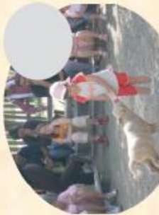
A/ La tétée des agneaux