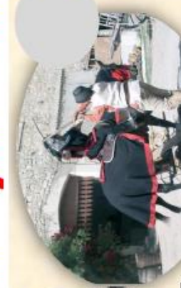
C/ spectacle médiéval (20mn)