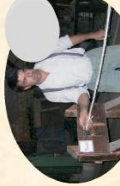
F/ fabrication de la corde