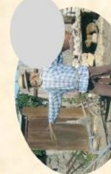
J/ l'histoire du papé (10mn)