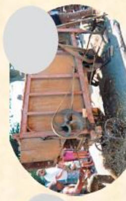
D/ mise en route de la Battuse (10mn)

NOUVEAUTE 2016 37. le moulin à eau 38. visite du dessus De l'encoule 39. la taverne