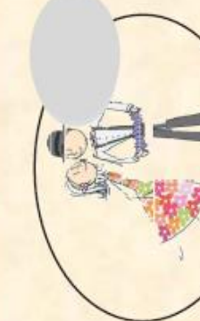
I/ le bal musette des automatés (5mn)