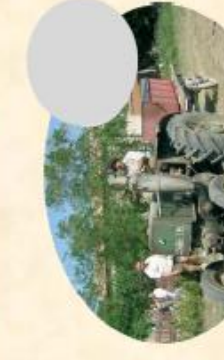
G/ mise en route du tracteur Vierzonn au chalumeau (15 mn)