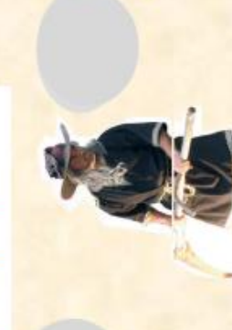
K/ spectacle Grabador le sorcier (15mn)