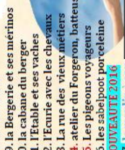
L/ l'envol des pigeons voyageurs (10mn)