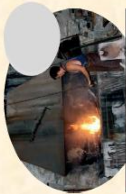
B/ le forgeron (25mn)

Promenade en petit train } Horaires affichées à la boutique, les tickets sont vendus à la boutiques Tour de manège } 1€ par personne 1€ par enfant